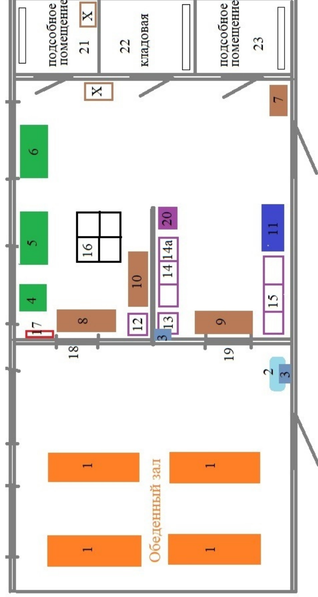
План-схема пищеблока МБОУ «СОШ № »